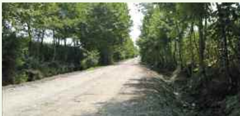
Strada Averolda come era prima e dopo l'intervento.